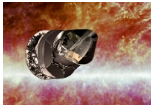
Das Universum kurz nach dem Urknall